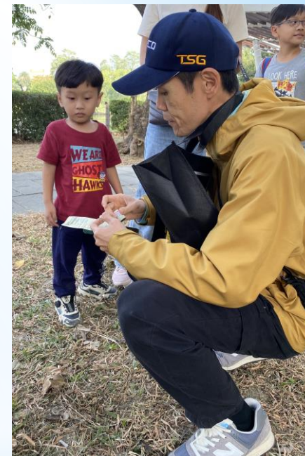
健走折返點蓋戳章