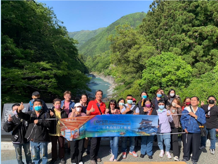
四國吉野川大小步危峽谷

* 2023年5月及6月本公司分二批舉辦員工出國旅遊，走訪日本四國高知縣等知名景點，與森林大海來一次親密探訪。