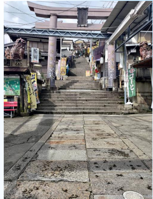
金刀比羅宮中段石階前