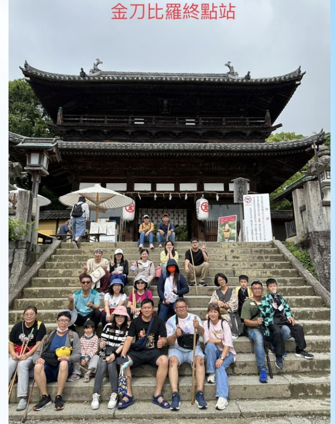
金刀比羅宮1,368階石階前