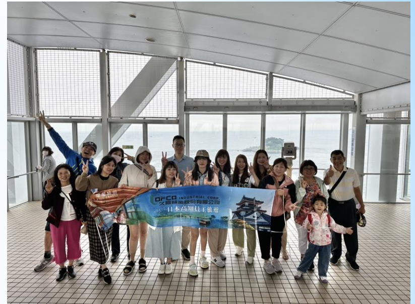
四國徳島縣鳴門漩渦入口處